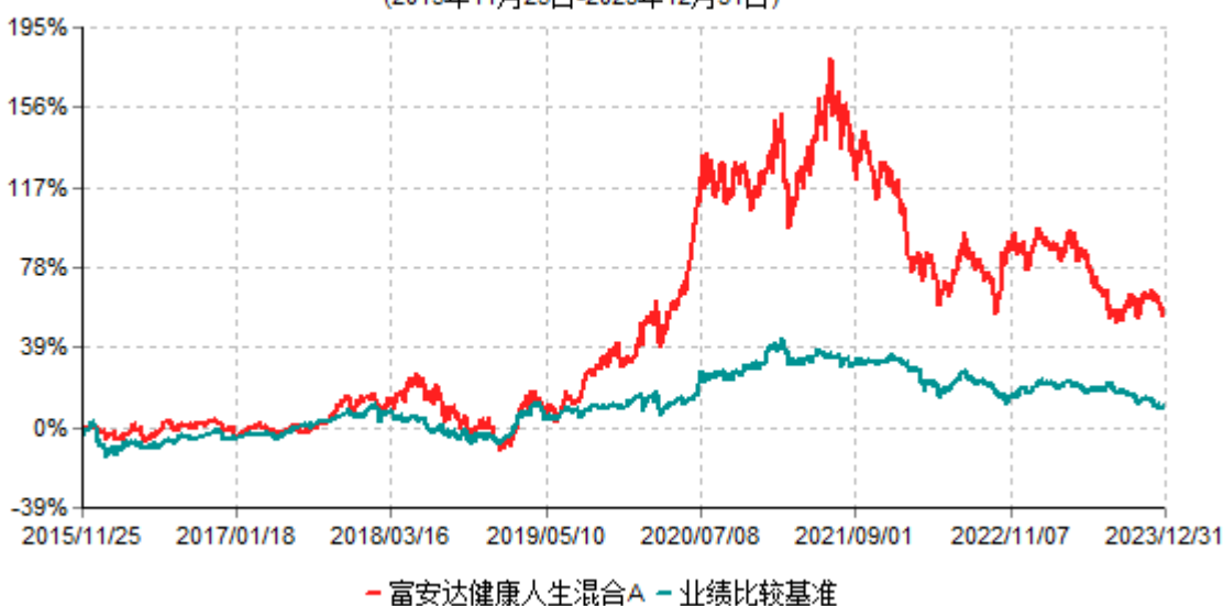
富安达健康人生混合A累计净值增长率与业绩比较基准收益率历史走势对比图 (2015年11月25日-2023年12月31日)