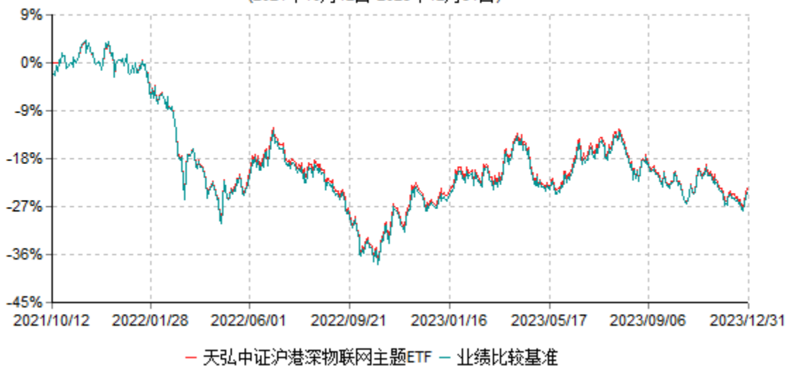
天弘中证沪港深物联网主题交易型开放式指数证券投资基金累计净值增长率与业绩比较基准 收益率历史走势对比图 (2021年10月12日-2023年12月31日)