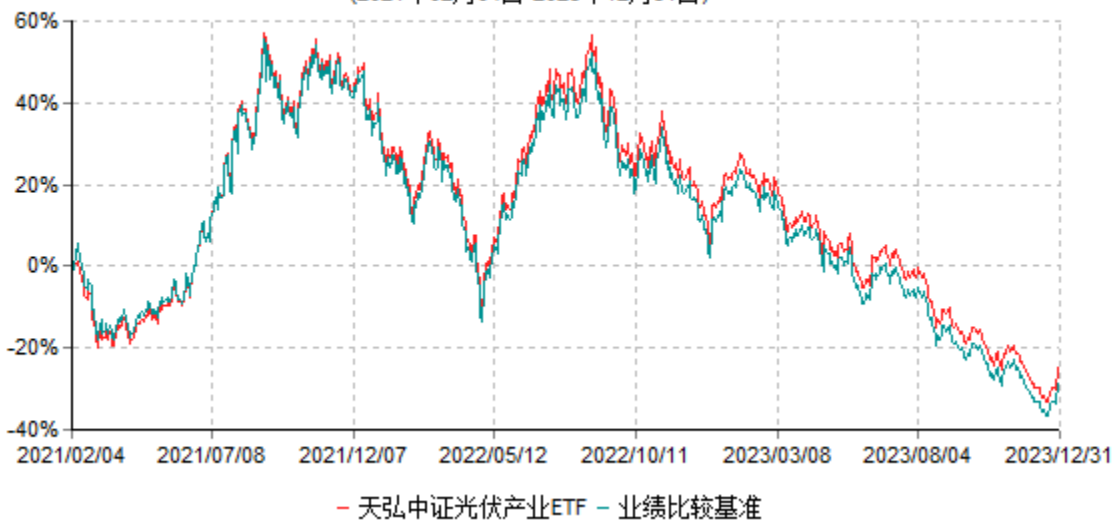
天弘中证光伏产业交易型开放式指数证券投资基金累计净值增长率与业绩比较基准收益率历史走势对比图 (2021年02月04日-2023年12月31日)