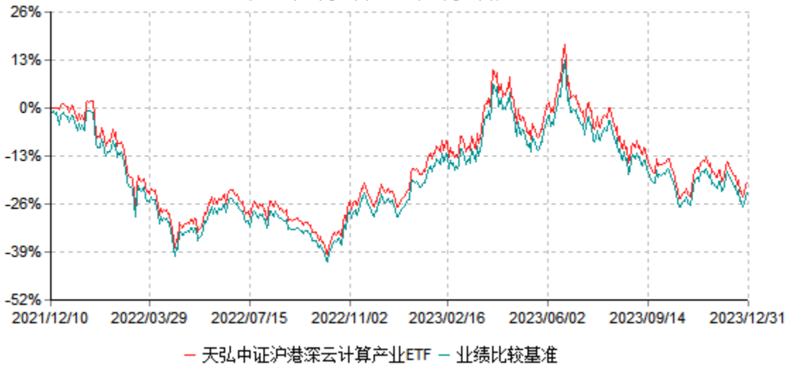
天弘中证沪港深云计算产业交易型开放式指数证券投资基金累计净值增长率与业绩比较基准 收益率历史走势对比图 (2021年12月10日-2023年12月31日)