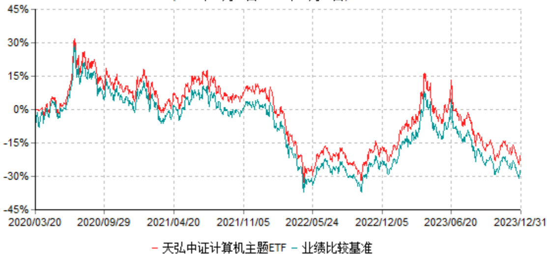
天弘中证计算机主题交易型开放式指数证券投资基金累计净值增长率与业绩比较基准收益率历史走势对比图 (2020年03月20日-2023年12月31日)

注：1、本基金合同于2020年03月20日生效。 2、本报告期内，本基金的各项投资比例达到基金合同约定的各项比例要求。