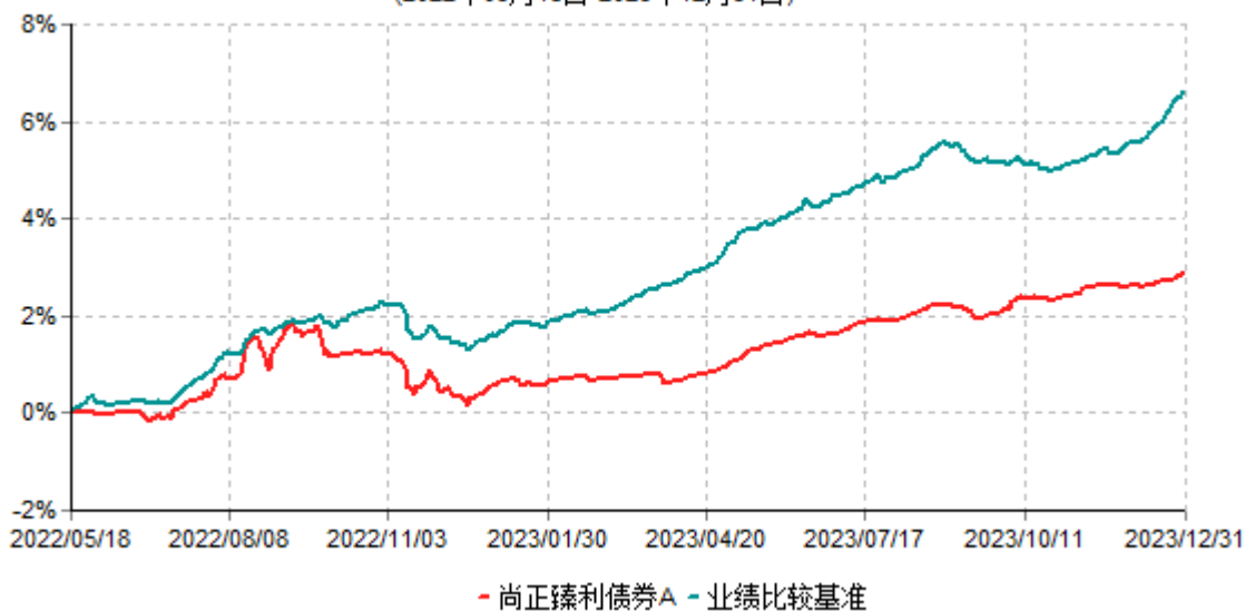
尚正臻利债券A累计净值增长率与业绩比较基准收益率历史走势对比图 (2022年05月18日-2023年12月31日)