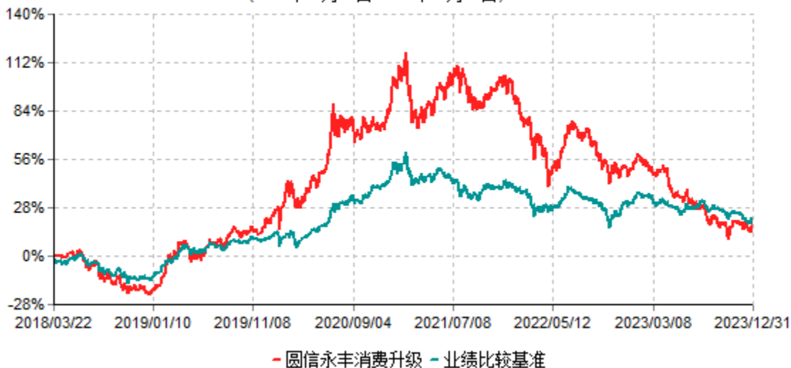
圆信永丰消费升级灵活配置混合型证券投资基金累计净值增长率与业绩比较基准收益率历史 走势对比图 (2018年03月22日-2023年12月31日)