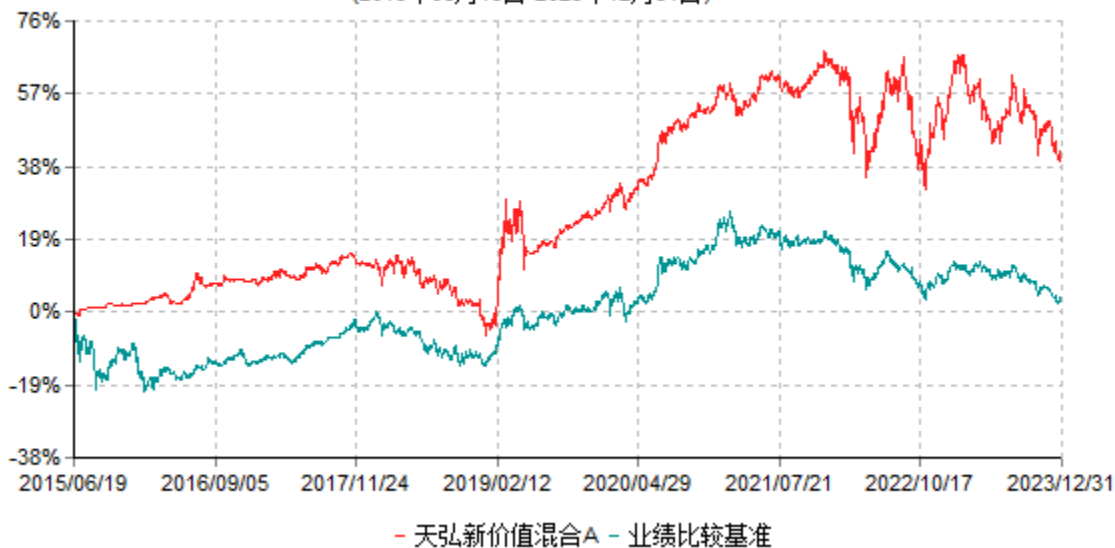
天弘新价值混合A累计净值增长率与业绩比较基准收益率历史走势对比图 (2015年06月19日-2023年12月31日)