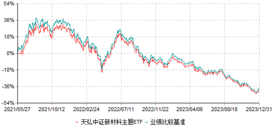
天弘中证新材料主题交易型开放式指数证券投资基金累计净值增长率与业绩比较基准收益率 历史走势对比图 (2021年05月27日-2023年12月31日)