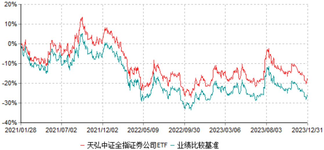
天弘中证全指证券公司交易型开放式指数证券投资基金累计净值增长率与业绩比较基准收益率历史走势对比图 (2021年01月28日-2023年12月31日)