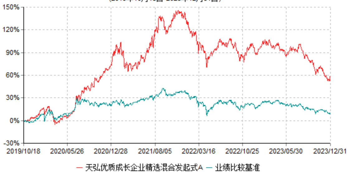
天弘优质成长企业精选混合发起式A累计净值增长率与业绩比较基准收益率历史走势对比图 (2019年10月18日-2023年12月31日)