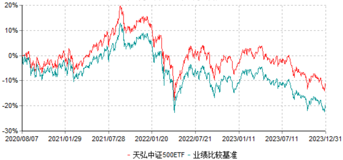
天弘中证500交易型开放式指数证券投资基金累计净值增长率与业绩比较基准收益率历史走势对比图 (2020年08月07日-2023年12月31日)