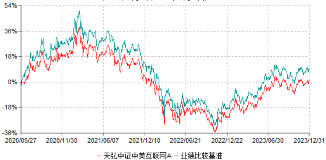
天弘中证中美互联网A累计净值增长率与业绩比较基准收益率历史走势对比图 (2020年05月27日-2023年12月31日)