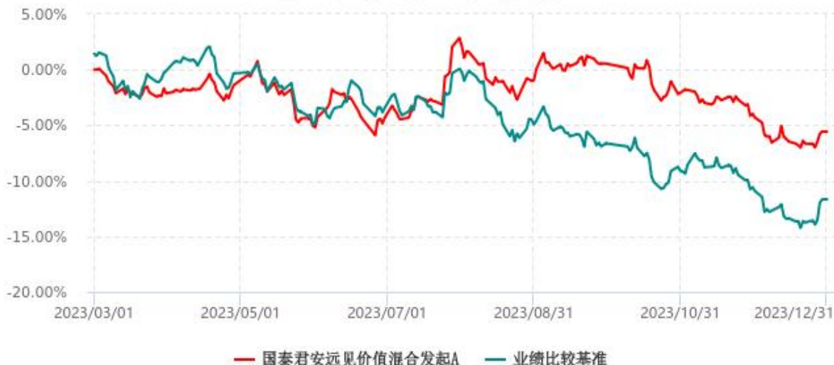
国泰君安远见价值混合发起A累计净值增长率与业绩比较基准收益率历史走势对比图 (2023年03月01日-2023年12月31日)

注：1、本基金于 2023 年 3 月 1 日成立，自合同生效日起至本报告期末不足一年。