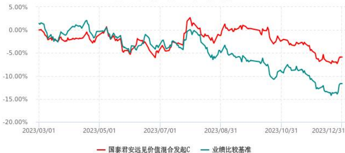
国泰君安远见价值混合发起C累计净值增长率与业绩比较基准收益率历史走势对比图 (2023年03月01日-2023年12月31日)

注：1、本基金于 2023 年 3 月 1 日成立，自合同生效日起至本报告期末不足一年。