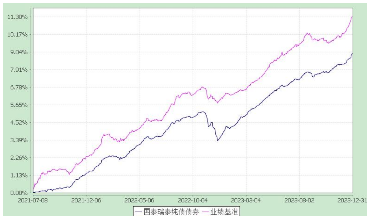
自基金合同生效以来份额累计净值增长率与业绩比较基准收益率的历史走势对比图 (2021 年 7 月 8 日至 2023 年 12 月 31 日)

注：本基金合同生效日为 2021 年 7 月 8 日，本基金在六个月建仓期结束时，各项资产配置比例符合合同约定。