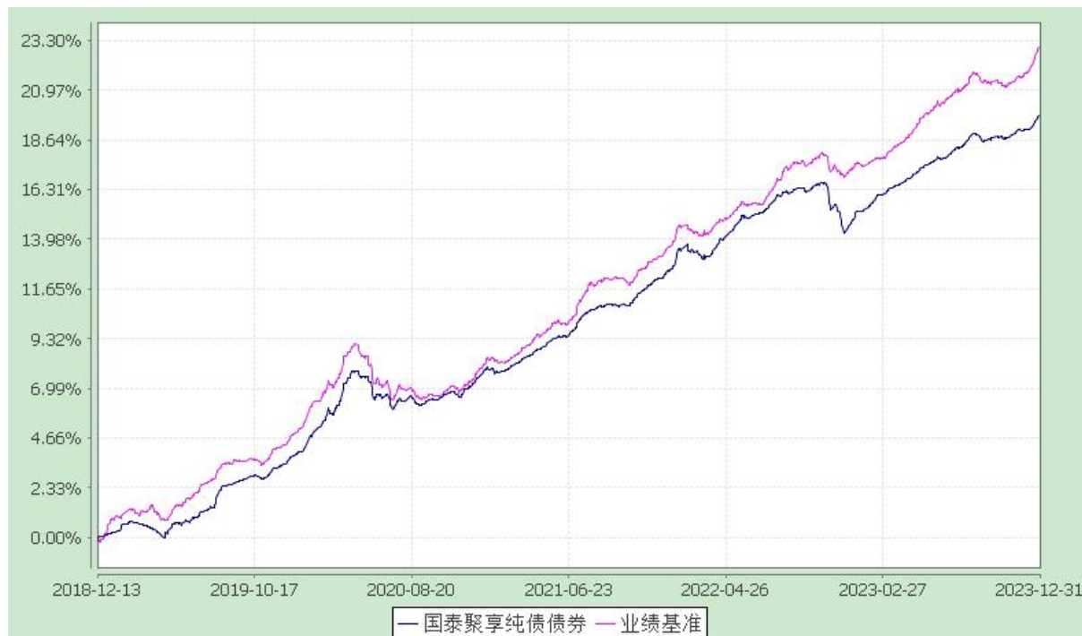
自基金合同生效以来份额累计净值增长率与业绩比较基准收益率的历史走势对比图 (2018 年 12 月 13 日至 2023 年 12 月 31 日)

注：本基金合同生效日为 2018 年 12 月 13 日。本基金在六个月建仓期结束时，各项资产配置比例符合合同约定。