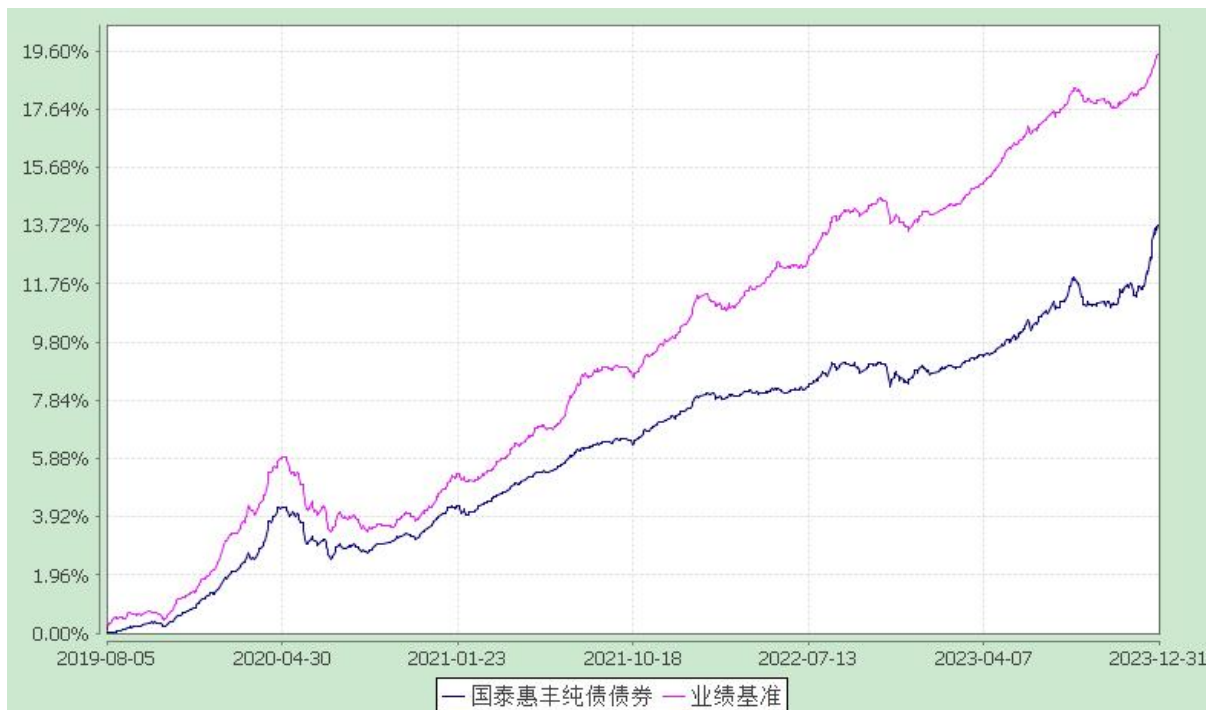
自基金合同生效以来份额累计净值增长率与业绩比较基准收益率的历史走势对比图 (2019 年 8 月 5 日至 2023 年 12 月 31 日)

注：本基金合同生效日为 2019 年 8 月 5 日，在六个月建仓期结束时，各项资产配置比例符合合同约定。