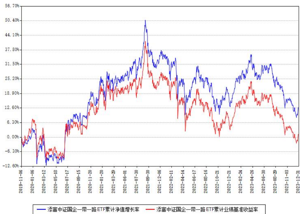
添富中证国企一带一路ETF累计净值增长率与同期业绩比较基准收益率对比图

注：本基金建仓期为本《基金合同》生效之日（2019年11月06日）起6个月，建仓期结束时各项资产配置比例符合合同约定。