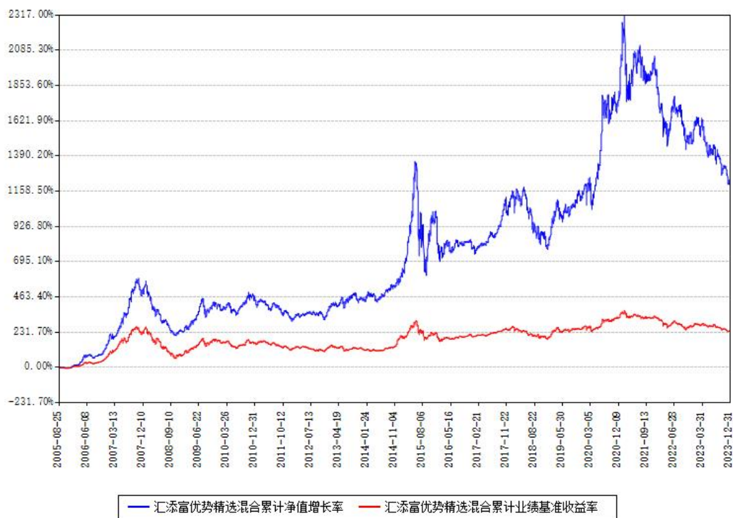
汇添富优势精选混合累计净值增长率与同期业绩比较基准收益率对比图

注：本基金建仓期为本《基金合同》生效之日（2005年08月25日）起6个月，建仓期结束时各项资产配置比例符合合同约定。