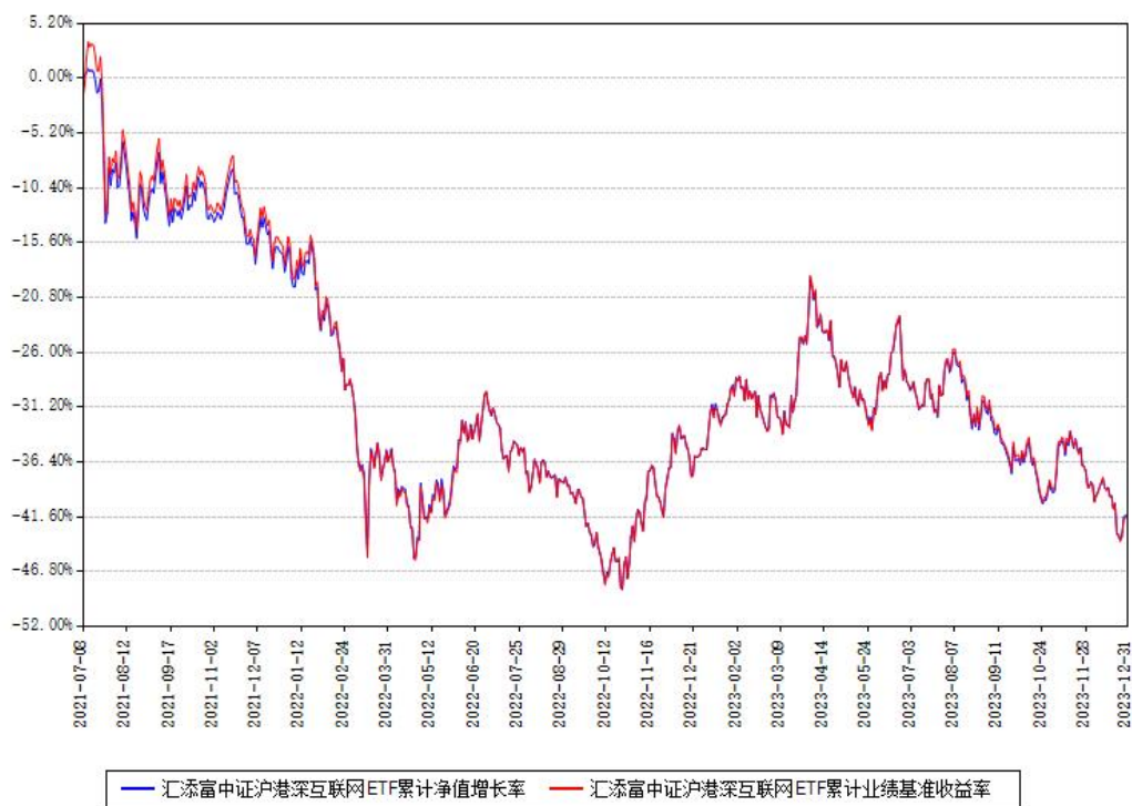
汇添富中证沪港深互联网ETF累计净值增长率与同期业绩比较基准收益率对比图

注：本基金建仓期为本《基金合同》生效之日（2021年07月08日）起6个月，建仓期结束时各项资产配置比例符合合同约定。