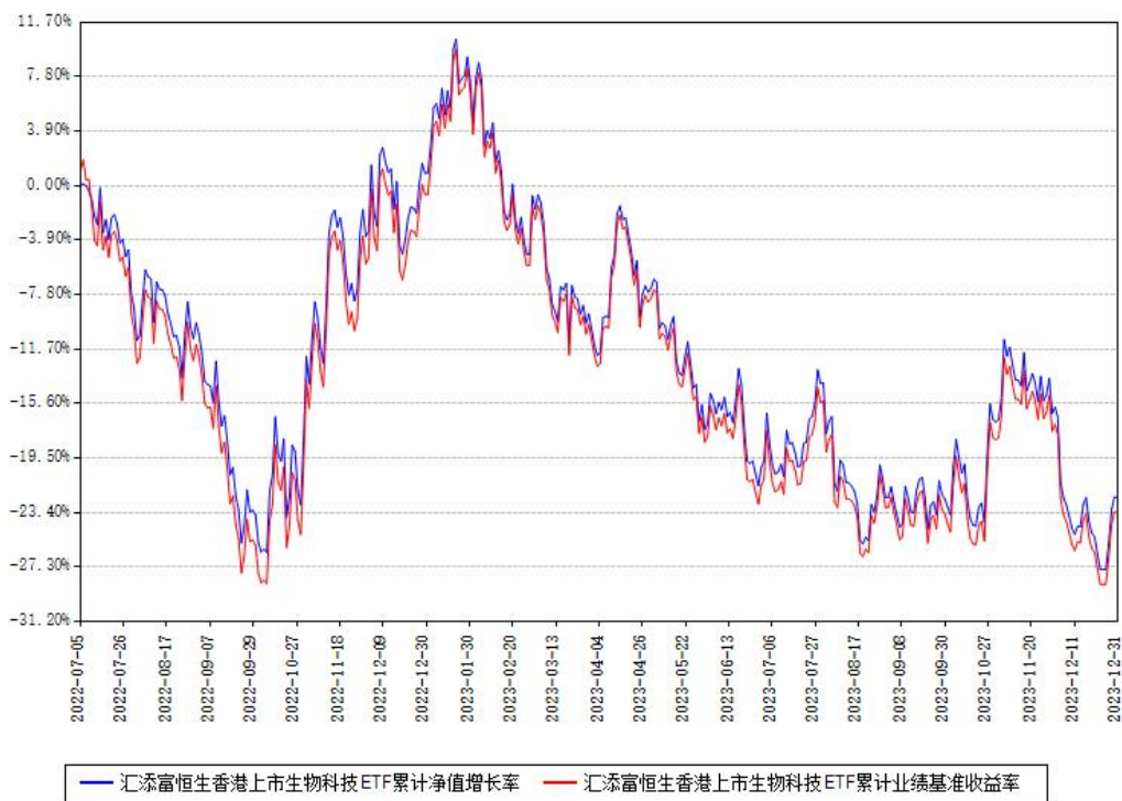
汇添富恒生香港上市生物科技ETF累计净值增长率与同期业绩基准收益率对比图

注：本基金建仓期为本《基金合同》生效之日（2022年07月05日）起6个月，建仓期结束时各项资产配置比例符合合同约定。