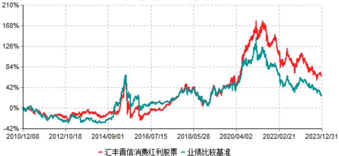
汇丰晋信消费红利股票型证券投资基金累计净值增长率与业绩比较基准收益率历史走势对比图 (2010年12月08日-2023年12月31日)

注：1.按照基金合同的约定，本基金的投资组合比例为：股票投资比例范围为基金资产的85%-95%，权证投资比例范围为基金资产净值的0%-3%。固定收益类证券、现金和其