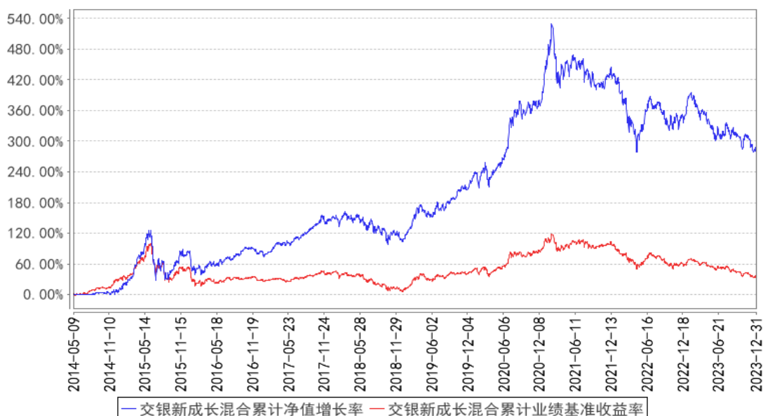
交银新成长混合累计净值增长率与同期业绩比较基准收益率的历史走势对比图

注：本基金建仓期为自基金合同生效日起的 6 个月。截至建仓期结束，本基金各项资产配置比例符合基金合同及招募说明书有关投资比例的约定。