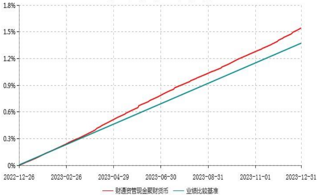
财通资管现金聚财货币市场基金累计净值收益率与业绩比较基准收益率历史走势对比图 (2022年12月26日-2023年12月31日)

注：本基金建仓期为自基金合同生效日起6个月，报告期末本基金已建仓完毕。截至建仓期结束，各项资产配置比例符合本基金基金合同约定。