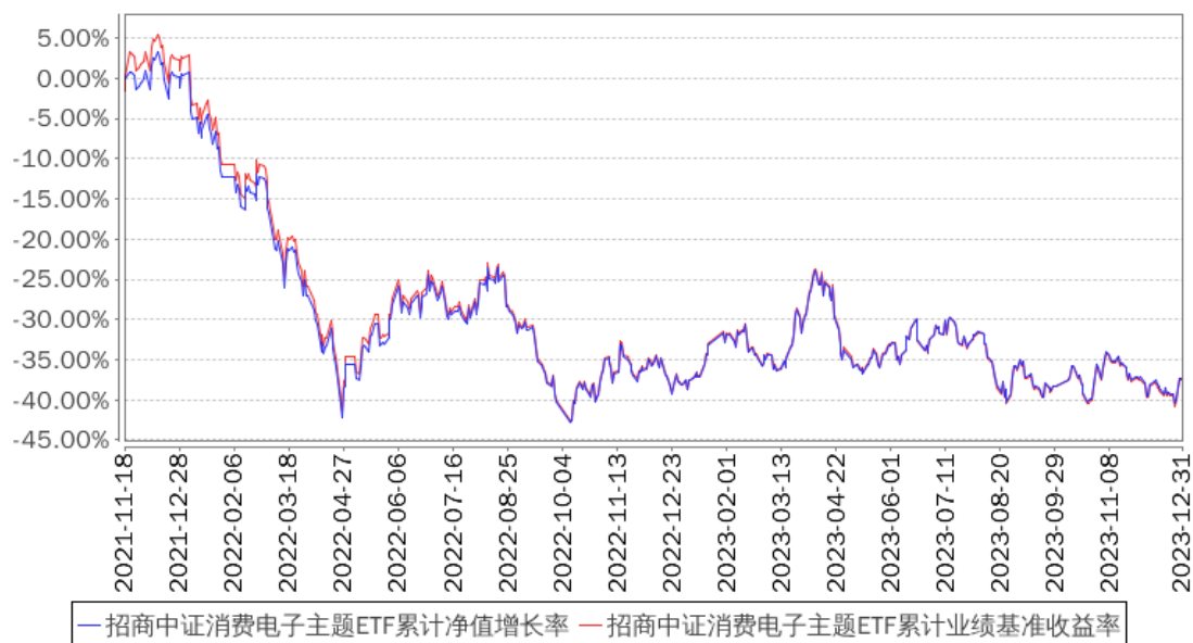
招商中证消费电子主题ETF累计净值增长率与同期业绩比较基准收益率的历史走势对比图