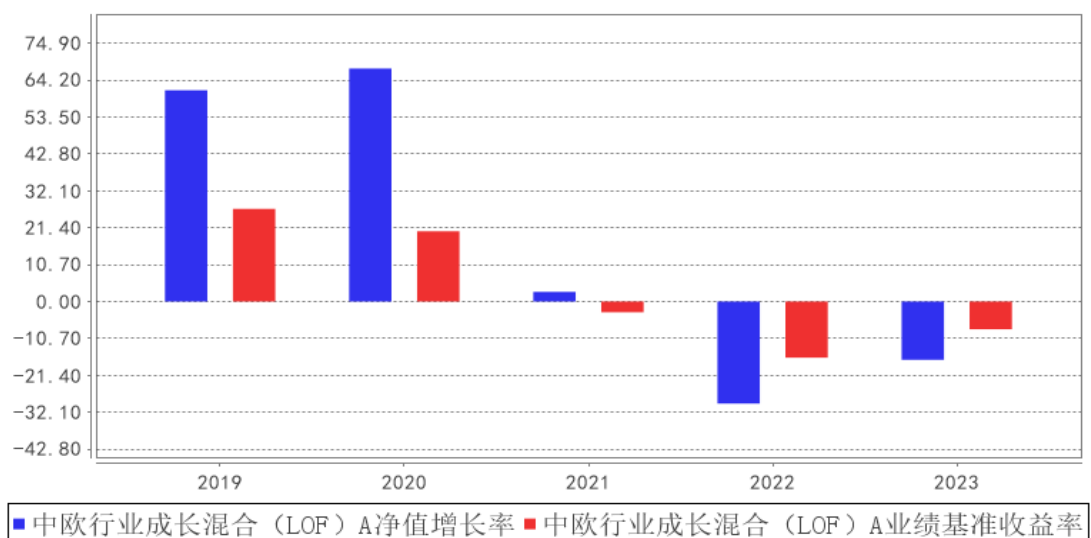
中欧行业成长混合 (LOF) A 基金每年净值增长率与同期业绩比较基准收益率的对比图