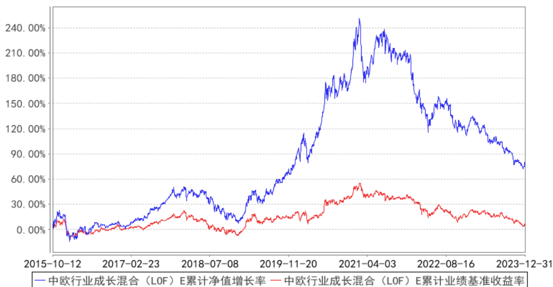
中欧行业成长混合 (LOF) E 累计净值增长率与同期业绩比较基准收益率的历史走势对比图

注：本基金自 2015 年 10 月 8 日新增 E 类份额，图示日期为 2015 年 10 月 12 日至 2023 年 12 月 31 日。