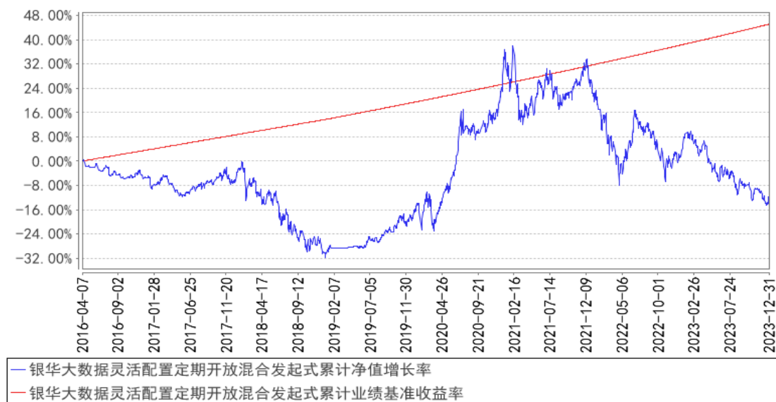
银华大数据灵活配置定期开放混合发起式累计净值增长率与同期业绩比较基准收益率的历史走势对比图

注：按基金合同的规定，本基金自基金合同生效起六个月内为建仓期，建仓期结束时本基金的各项投资比例已达到基金合同的规定：在开放期内股票投资比例为基金资产的 0%-95%，在封闭期内股票投资比例为基金资产的 0%-100%；权证投资比例为基金资产净值的 0%-3%；开放期内的每个交易日日终，在扣除股指期货合约需缴纳的交易保证金后，应当保持不低于基金资产净值 5%的现金或到期日在一年以内的政府债券。在封闭期内，本基金不受上述 5%的限制，但每个交易日日终在扣除股指期货合约需缴纳的交易保证金后，应当保持不低于交易保证金一倍的现金。其中，现金不包括结算备付金、存出保证金、应收申购款等。