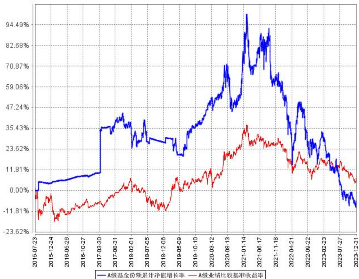
A级基金份额累计净值增长率与同期业绩比较基准收益率的历史走势对比图