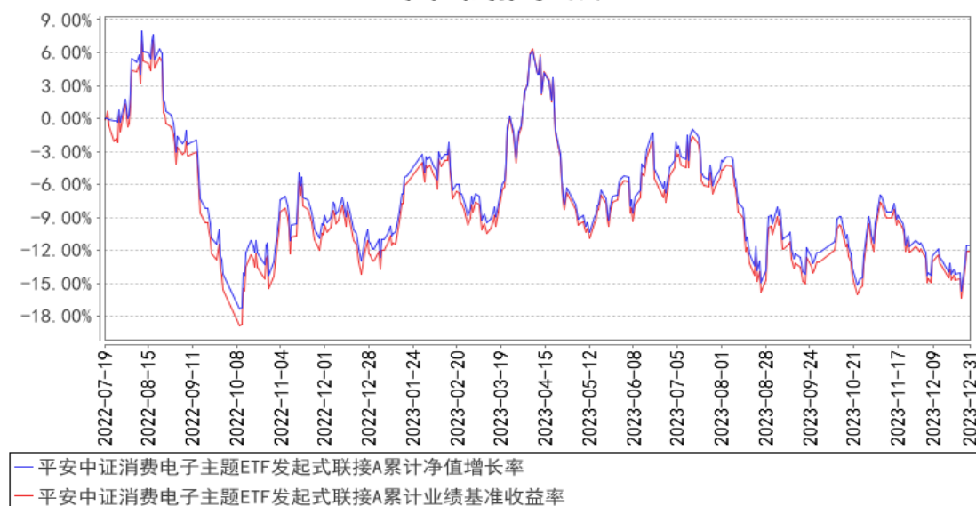
平安中证消费电子主题ETF发起式联接A累计净值增长率与同期业绩比较基准收益率的历史走势对比图