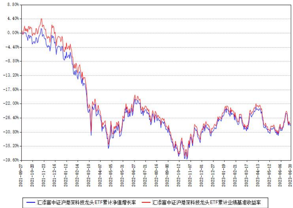
汇添富中证沪港深科技龙头ETF累计净值增长率与同期业绩基准收益率对比图