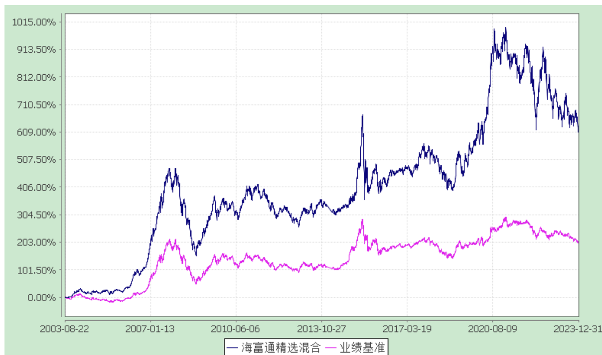
海富通精选证券投资基金 份额累计净值增长率与业绩比较基准收益率的历史走势对比图 (2003 年 8 月 22 日至 2023 年 12 月 31 日)

注：1、按基金合同规定,本基金自基金合同生效起 6 个月内为建仓期。本基金自 2007 年 6 月 28 日至 2007 年 9 月 29 日,为持续营销后建仓期。建仓期满至今,本基金投资组合均达到本基金合同第十八条(三)、(六)规定的比例限制及本基金投资组合的比例范围。 2、为了能更公允地体现基金投资业绩,海富通基金管理有限公司自 2007 年 1 月 1 日起调整海富通精选基金业绩比较基准中股票部分的基准。原比较基准中的上证指数调整为 MSCI China A 指数,相应的基准权重不变。