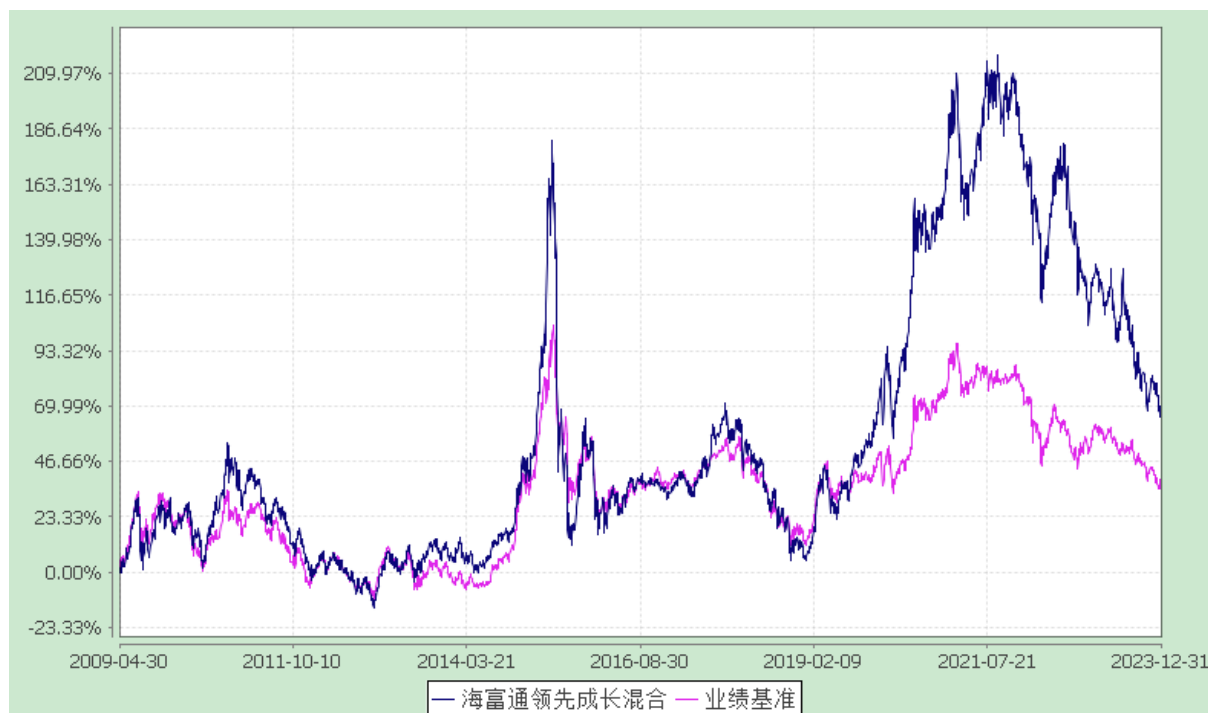
海富通领先成长混合型证券投资基金 份额累计净值增长率与业绩比较基准收益率的历史走势对比图 (2009年4月30日至2023年12月31日)

注：按照基金合同规定，本基金建仓期为基金合同生效之日起六个月，即 2009 年 4 月 30 日至 2009 年 10 月 29 日。建仓期结束时本基金投资组合均达到本基金合同第十二条（二）、（七）规定的比例限制及本基金投资组合的比例范围。