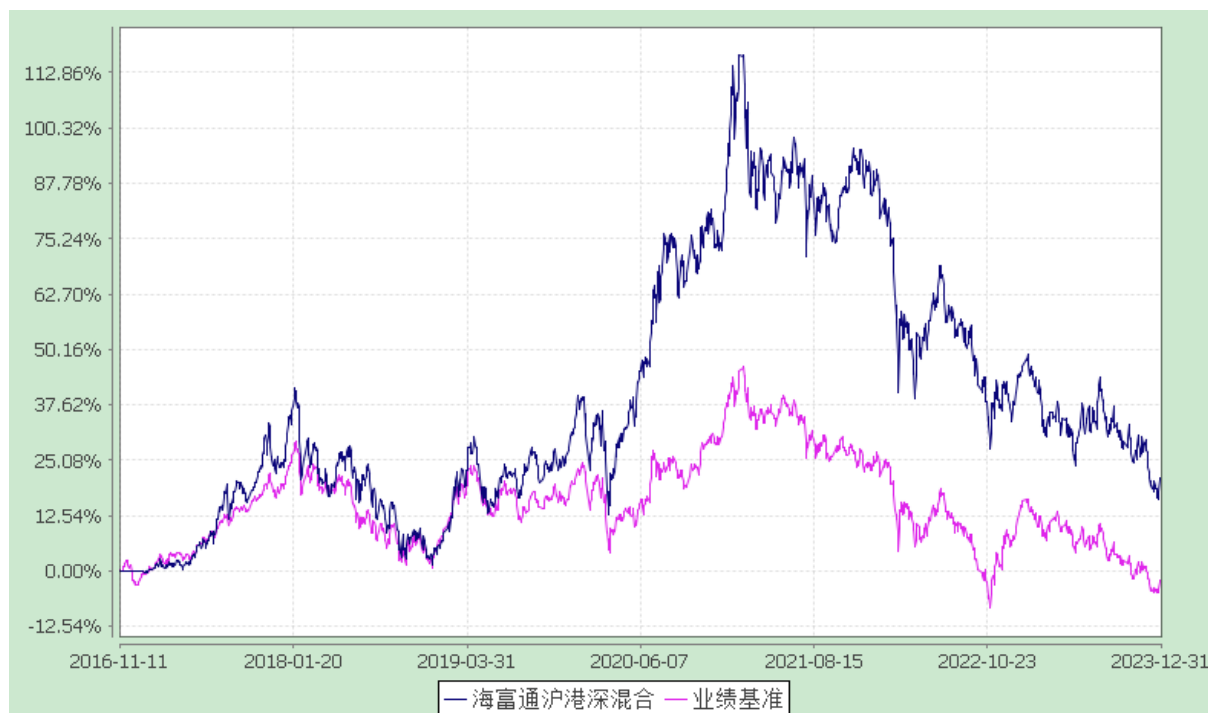
海富通沪港深灵活配置混合型证券投资基金 份额累计净值增长率与业绩比较基准收益率的历史走势对比图 (2016年11月11日至2023年12月31日)

注：本基金合同于2016年11月11日生效。按基金合同规定，本基金自基金合同生效起6个月内为建仓期。建仓期结束时本基金的各项投资比例已达到基金合同第十二部分（二）投资范围、（四）投资限制中规定的各项比例。