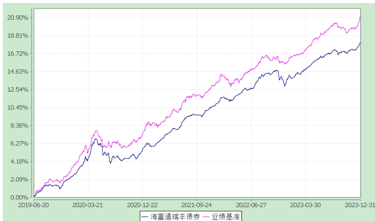
海富通瑞丰债券型证券投资基金 份额累计净值增长率与业绩比较基准收益率的历史走势对比图 (2019年6月20日至2023年12月31日)

注：本基金于2019年6月20日进行了转型。按照本基金合同规定，本基金建仓期为自基金合同生效起六个月。建仓期结束时本基金的各项投资比例已达到基金合同第十二部分（二）投资范围、（四）投资限制中规定的各项比例。