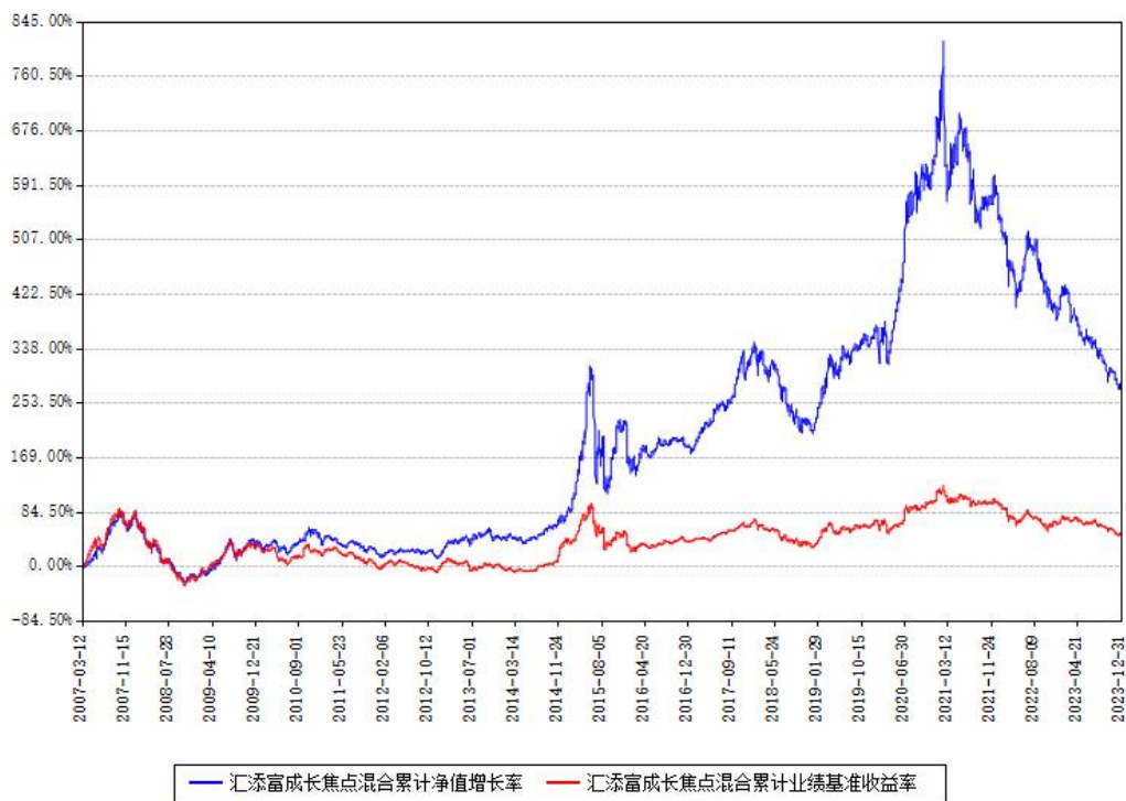
汇添富成长焦点混合累计净值增长率与同期业绩基准收益率对比图

注：本基金建仓期为本《基金合同》生效之日（2007年03月12日）起6个月，建仓期结束时各项资产配置比例符合合同约定。