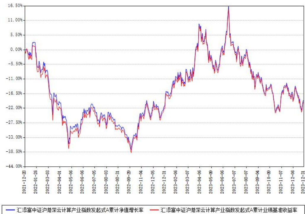
汇添富中证沪港深云计算产业指数发起式A累计净值增长率与同期业绩基准收益率对比图