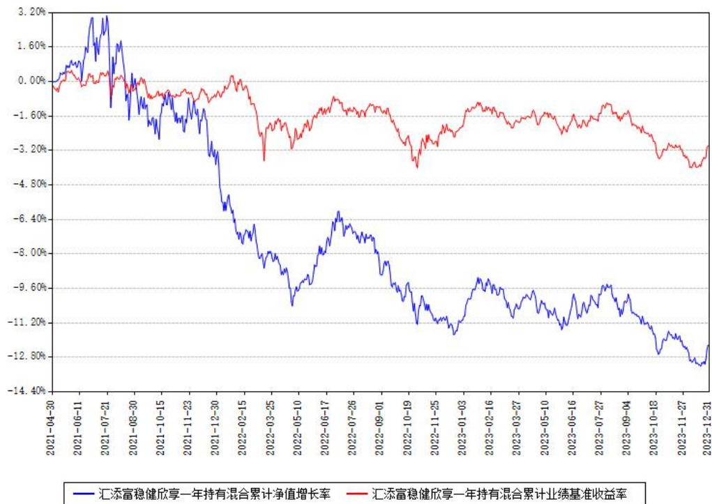
汇添富稳健欣享一年持有混合累计净值增长率与同期业绩基准收益率对比图

注：本基金建仓期为本《基金合同》生效之日（2021年04月30日）起6个月，建仓期结束时各项资产配置比例符合合同约定。