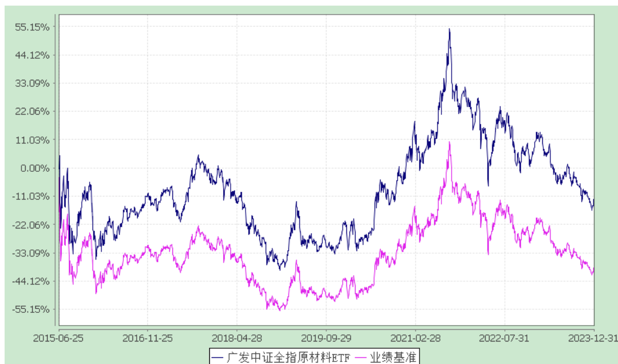
广发中证全指原材料交易型开放式指数证券投资基金 份额累计净值增长率与业绩比较基准收益率的历史走势对比图 (2015年6月25日至2023年12月31日)