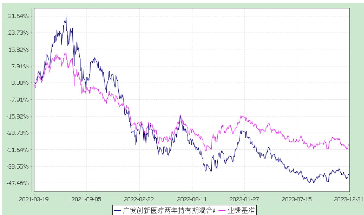
广发创新医疗两年持有期混合 C