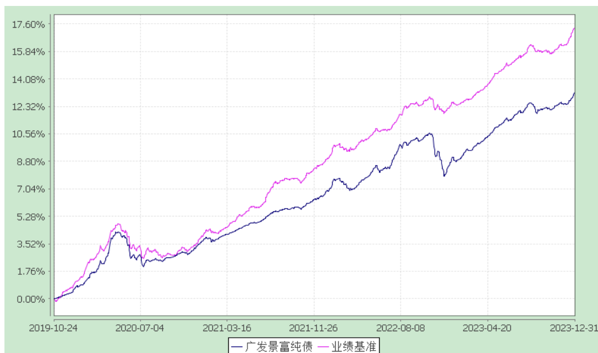
广发景富纯债债券型证券投资基金 份额累计净值增长率与业绩比较基准收益率的历史走势对比图 (2019 年 10 月 24 日至 2023 年 12 月 31 日)