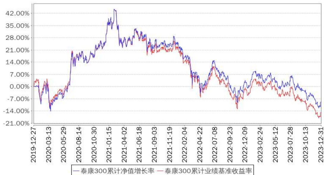
泰康300累计净值增长率与同期业绩比较基准收益率的历史走势对比图