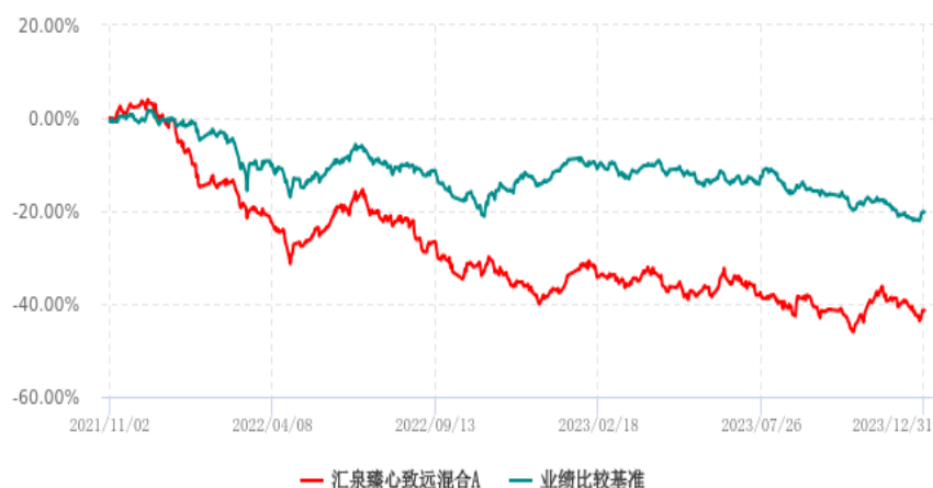
汇泉臻心致远混合A累计净值增长率与业绩比较基准收益率历史走势对比图 (2021年11月02日-2023年12月31日)