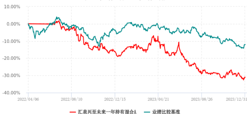
汇泉兴至未来一年持有混合A累计净值增长率与业绩比较基准收益率历史走势对比图 (2022年04月06日-2023年12月31日)