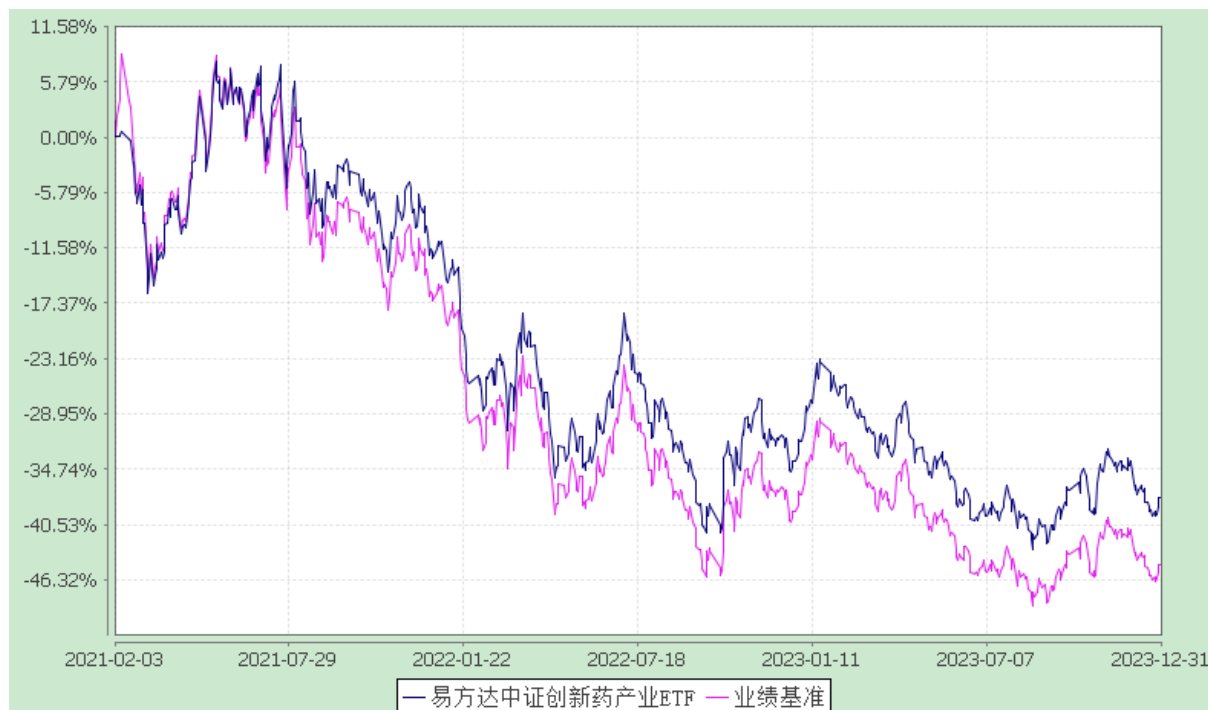
易方达中证创新药产业交易型开放式指数证券投资基金 份额累计净值增长率与业绩比较基准收益率历史走势对比图 (2021年2月3日至2023年12月31日)

注：自基金合同生效至报告期末，基金份额净值增长率为-37.79%，同期业绩比较基准收益率为-44.78%。