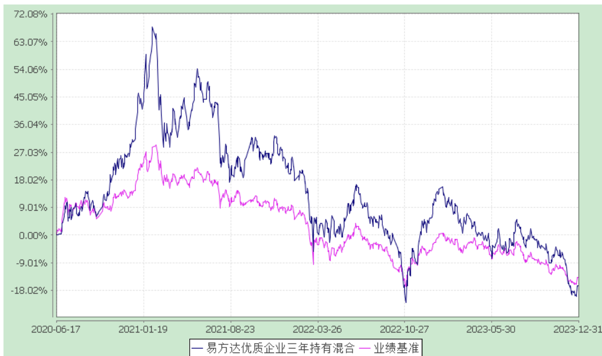
易方达优质企业三年持有期混合型证券投资基金 份额累计净值增长率与业绩比较基准收益率历史走势对比图 (2020年6月17日至2023年12月31日)

注：自基金合同生效至报告期末，基金份额净值增长率为-16.53%，同期业绩比较基准收益率为-13.77%。