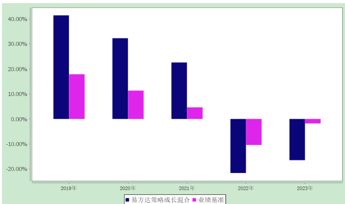
过去五年基金净值增长率与业绩比较基准历年收益率对比图