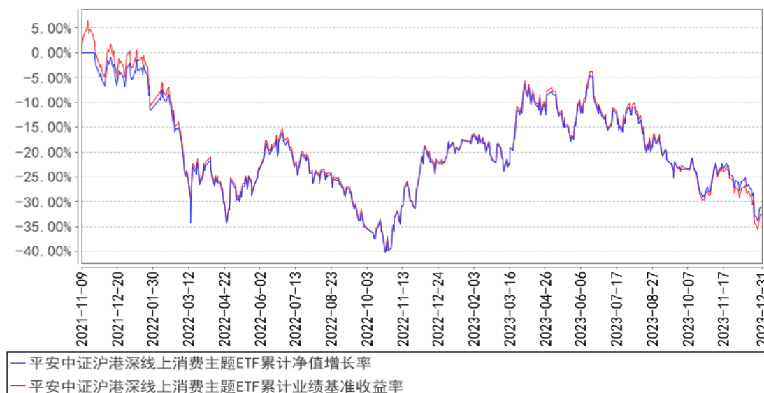
平安中证沪港深线上消费主题ETF累计净值增长率与同期业绩比较基准收益率的历史走势对比图