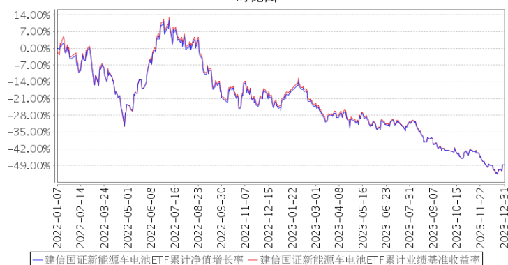
建信国证新能源车电池ETF累计净值增长率与同期业绩比较基准收益率的历史走势对比图