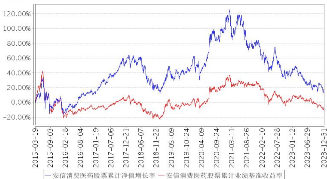
安信消费医药股票累计净值增长率与同期业绩比较基准收益率的历史走势对比图