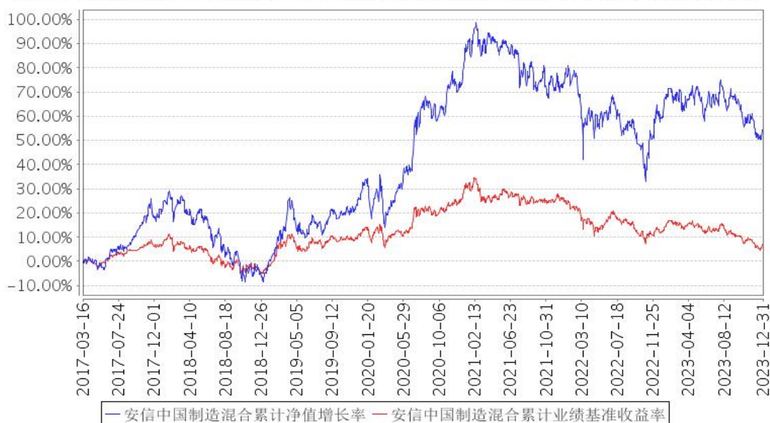
安信中国制造混合累计净值增长率与同期业绩比较基准收益率的历史走势对比图